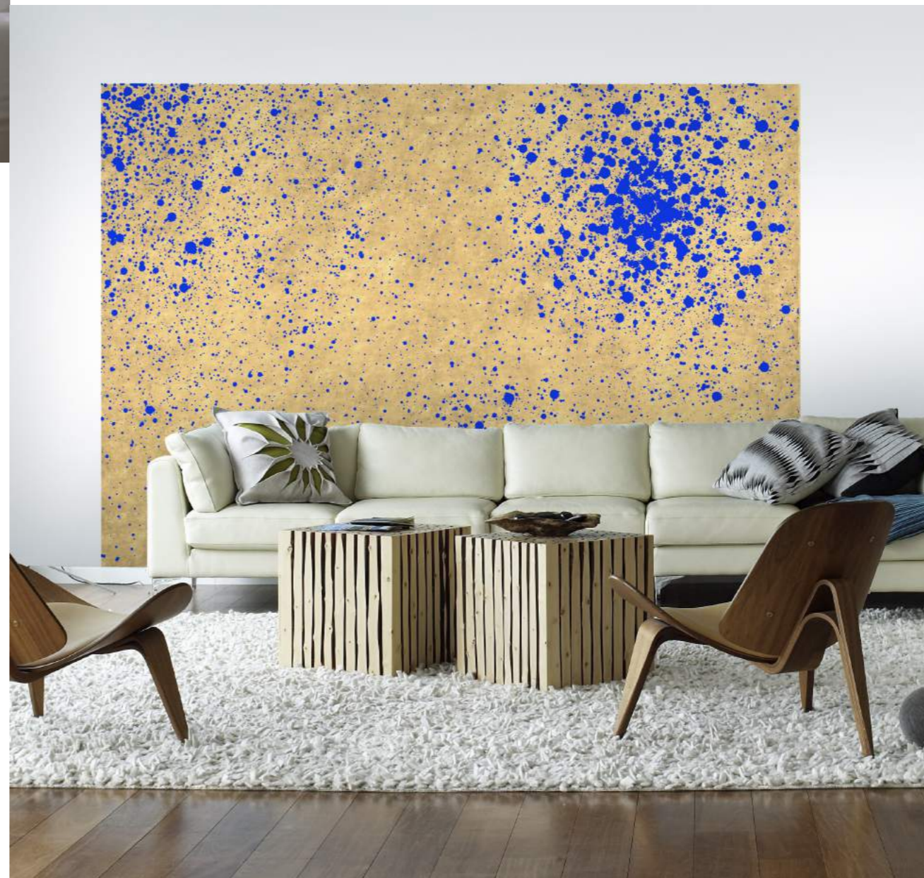
▼ Les Dorés, Splash Remous bleus © Gaëlle Le Boulicaut

Avec ses décors muraux et autres panneaux décoratifs aux délicates influences japonaises ou Renaissance, L'Atelier du Mur explore tout un éventail de solutions esthétiques pour architectes d'intérieur et clients particuliers, à l'image de son nouvel axe de développement : les papiers peints imprimés Signature .