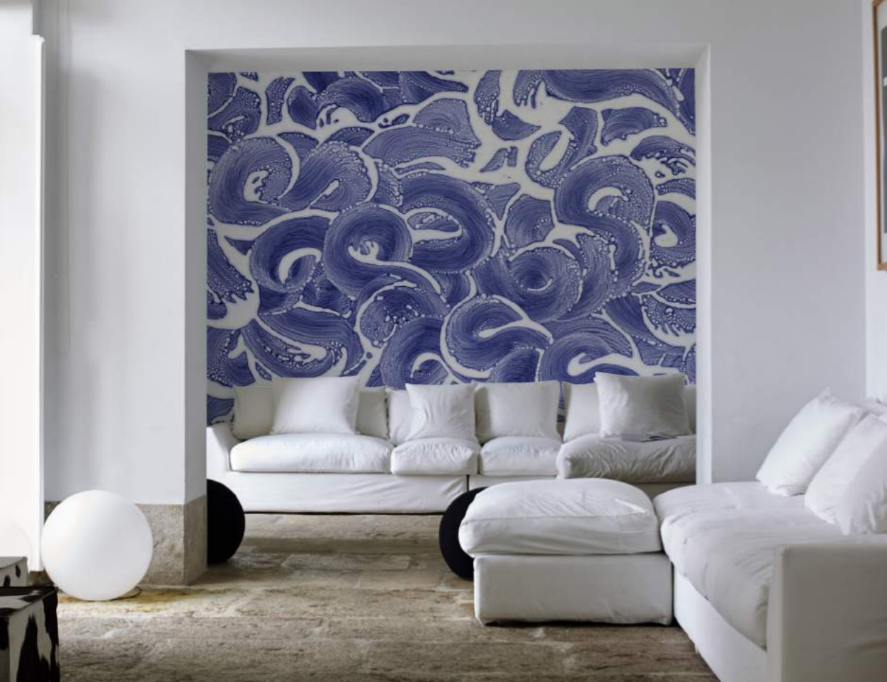
◀ Paysages singuliers, Remous bleus